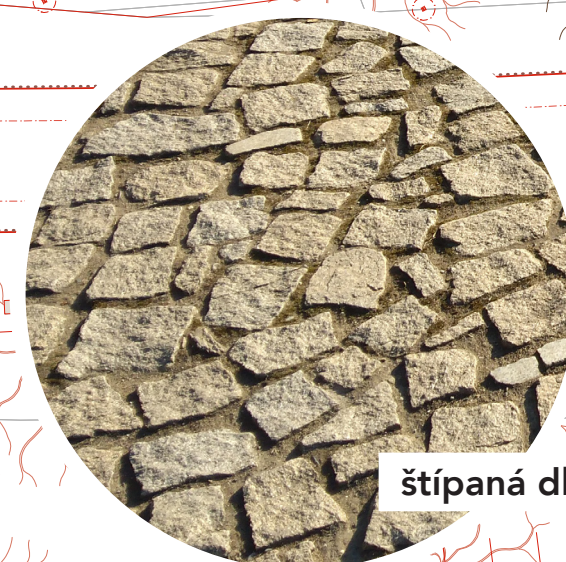
štípaná dlažba - jednotná pro chodníky i nástupiště