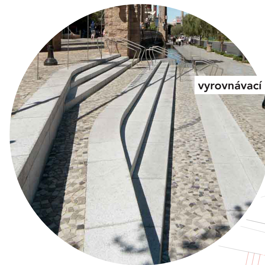
vyrovnávací schody jako místo setkání