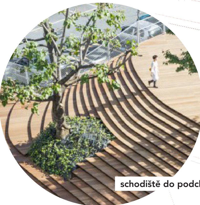
schodiště do podchodu v zeleni